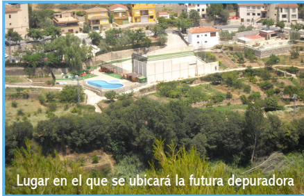
Lugar en el que se ubicará la futura depuradora

La empresa adjudicataria de este proyecto ha sido Mundifon Instalaciones y cuenta con un plazo de ejecución de seis meses. La actuación comenzará en septiembre y supondrá reparar grietas y goteras del actual depósito que se ubica en la era de los Hilarios y abastece a la población gracias a su capacidad para albergar más de 100.000 litros. También se sustituirán algunas llaves de paso que se encuentran deterioradas y por último se instalará un descalcificador que evitará los problemas que se derivan de la sa-